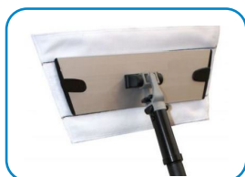
Lanca do mycia wewnętrznego okien