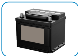
Akumulator 12V / 18 Ah