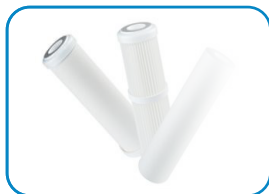
3 wkłady: mechaniczny, węglowy, żywica jonowymienna