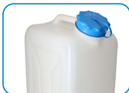
Zbiornik na wodę