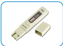
Wskaźnik TDS – ręczny pomiar